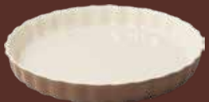
Tortiera tortora Dove-gray pie dish cm ø 30x4h