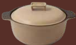
Pentola con coperchio tortora Dove-gray cooking pot with lid cm ø 28,5x33,5x18h - cl 400

For cooking over the flame, oven, microwave and electric plate.