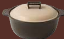
Pentola con coperchio antracite Black cooking pot with lid cm ø 20x25x14h - cl 150