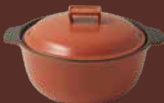
Pentola con cop. rosso mattone Brick-red cooking pot with lid cm ø 23,5x28,5x15,5h - cl 250