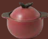
Casseruola con coperchio prugna Plum-red casserole with lid cm ø 15x18,5x14,5h - cl 90

Le pentole, le tajine e i tegami sono disponibili nelle varianti colore tortora, rosso mattone e antracite.