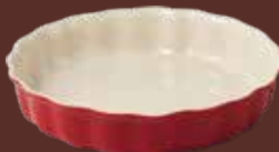
Tortiera rosso mattone Brick-red pie dish cm ø 26x5h