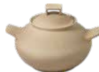
Cuocipatate con coperchio cm ø 22x27,5x17h - cl 330

Il Cuocipatate è realizzato con una particolare argilla da fiamma, naturale e non smaltata, per una cottura esclusivamente a secco (con totale assenza di acqua). Non è necessario usare la retina spargifiamma.