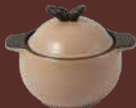
Casseruola con coperchio tortora Dove-gray casserole with lid cm ø 15x18,5x14,5h - cl 90