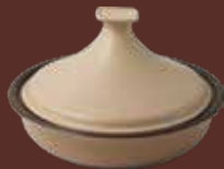
Tajine con coperchio tortora Dove-gray tajine with lid cm ø 31,5x19,5h - cl 250