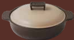
Tegame con coperchio antracite Black saucapan with lid cm ø 27,5x33,5x13,5h - cl 250